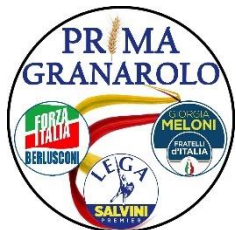
Gruppo consiliare "Prima Granarolo"