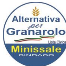
Gruppo consiliare "Alternativa per Granarolo"