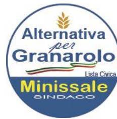
Gruppo consiliare "Alternativa per Granarolo"