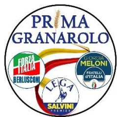
Gruppo consiliare "Prima Granarolo"