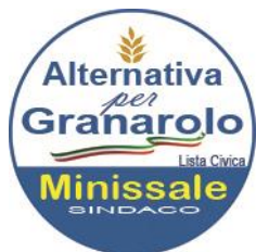
Gruppo consiliare "Alternativa per Granarolo"