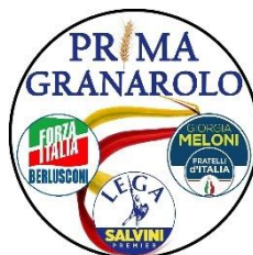
Gruppo consiliare "Prima Granarolo"